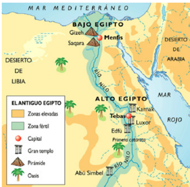
Ilustración 1. Geografía del Antiguo Egipto.