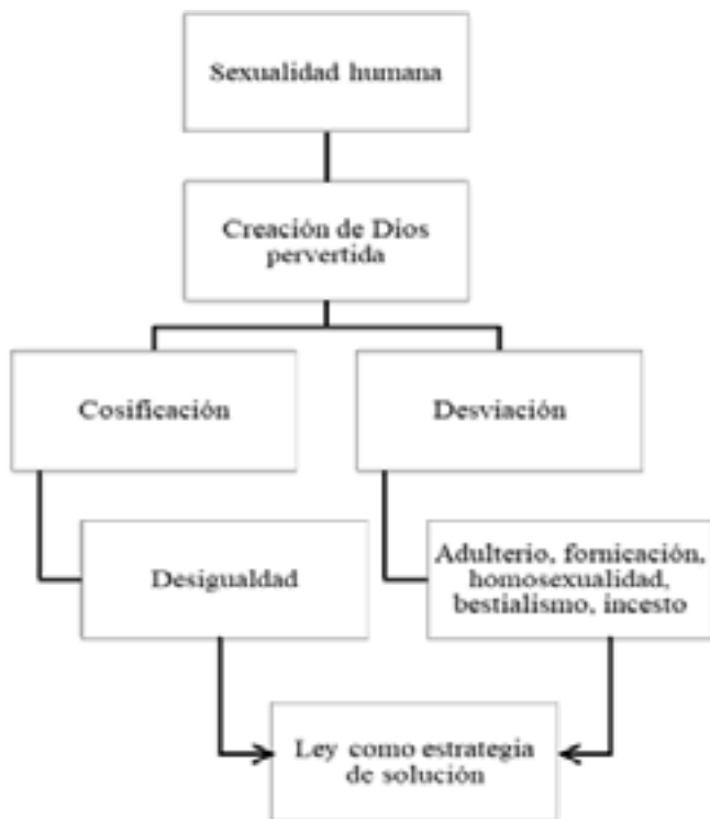
Figura 1. Modelo nomológico de la sexualidad

La situación compleja que provocó el pecado en el ámbito sexual y el camino de solución que planteó Dios podrían ser sintetizados a través del esquema trazado en la Figura 1: